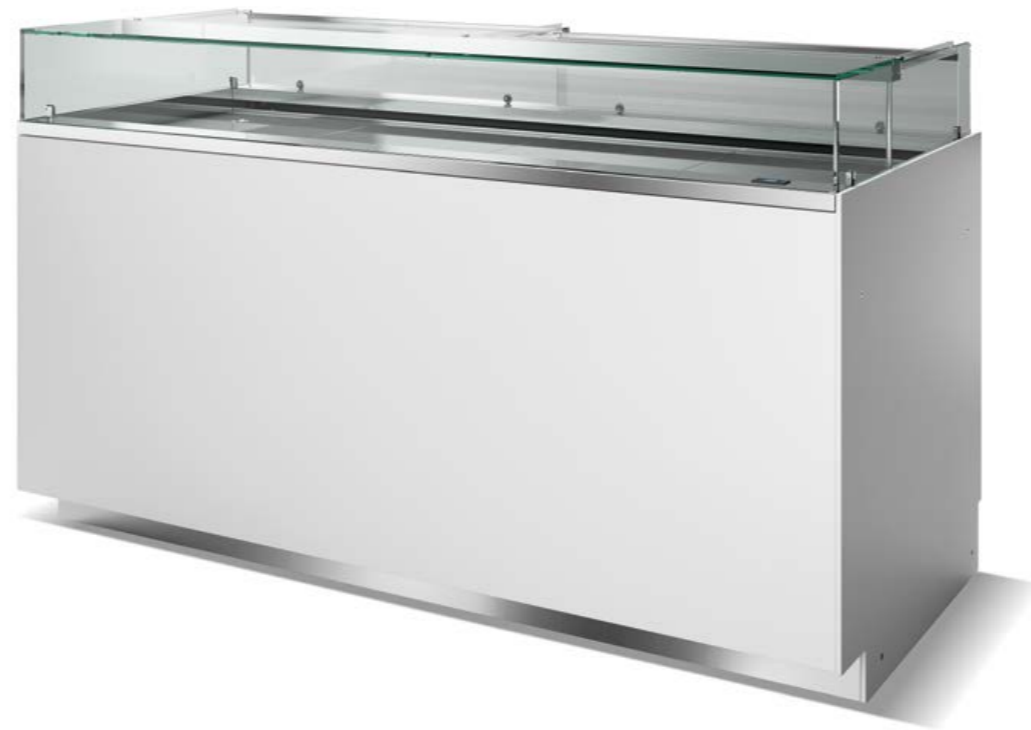
Linear display case Vetrina Lineare

Freddo Ventilato Freddo Ventilato con piano caldo Freddo Ventilato per Praline Caldo secco