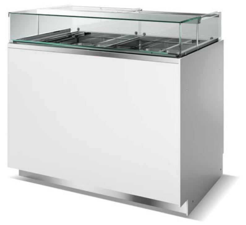
Gelato display case Vetrina Gelato

Freddo Ventilato Freddo Ventilato con piano caldo Freddo Ventilato per Praline Caldo secco