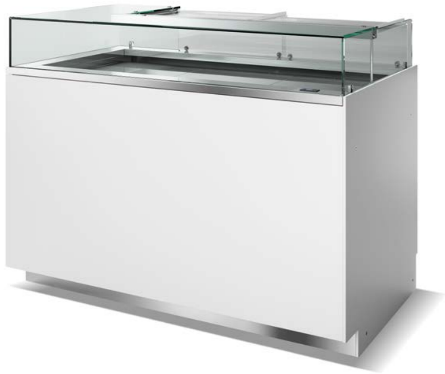
Corner display case Vetrina Angolare